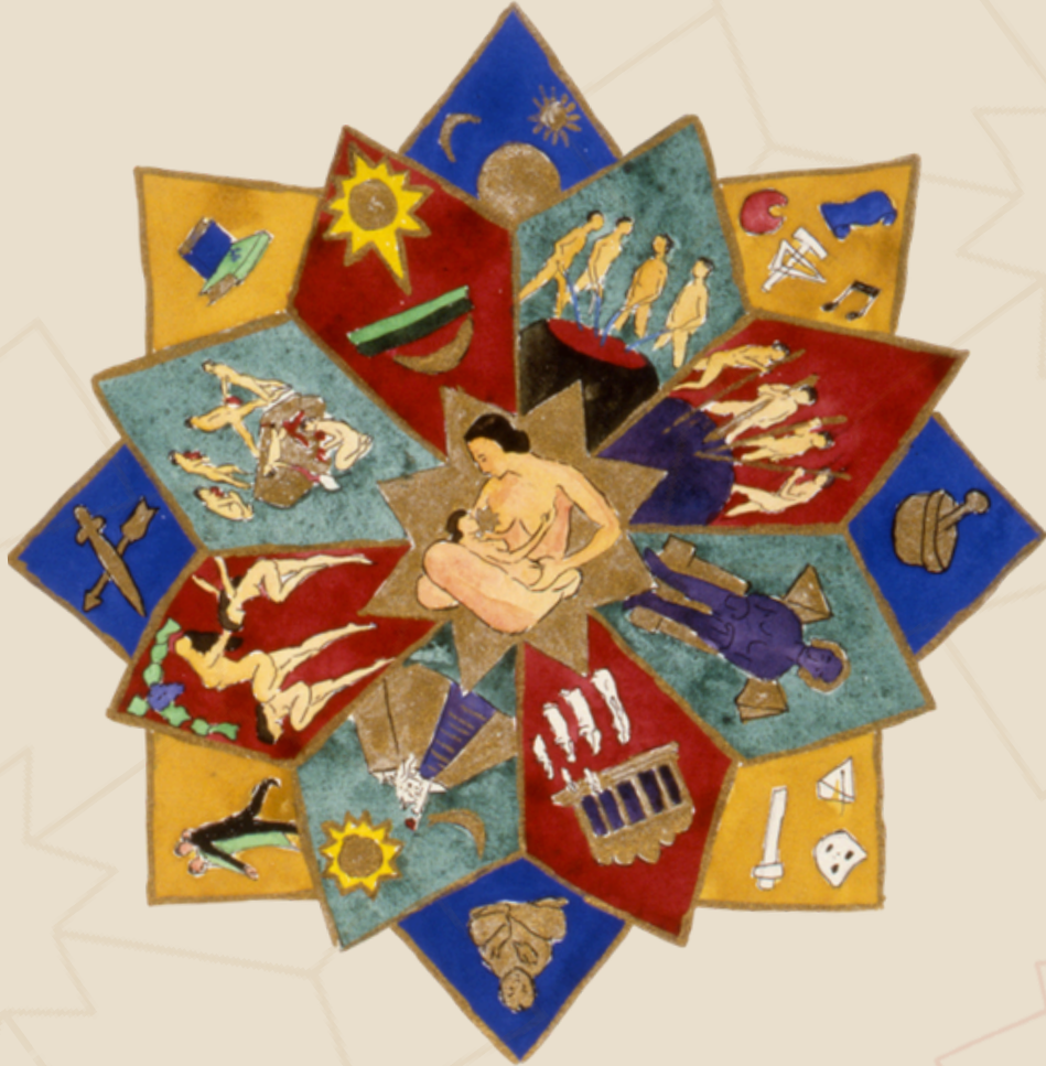
Bild: 003 ACAB, Anonymes Bild eines Patienten

27.08.2026 - 30.08.2026 WIEN, PALAIS ESCHENBACH | ONLINE